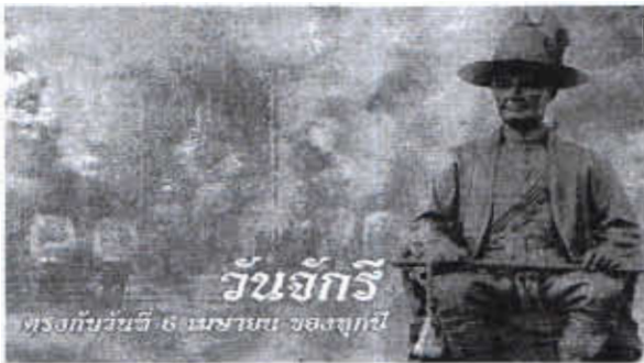
๖ เมษายน วันจักรี

“ เราจะครองแผ่นดินโดยธรรม เพื่อประโยชน์สุขแห่งมหาชนชาวสยาม ” พระปฐมบรมราชโองการ พระบาทสมเด็จพระเจ้าอยู่หัวภูมิพลอดุลยเดชฯ