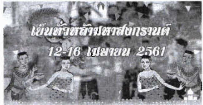
๑๒-๑๖ เมษายน วันสงกรานต์

สวัสดี.....ผู้อ่านทุกท่านกับวารสารจัดหางานสัมพันธ์ ฉบับประจำเดือนเมษายน ๒๕๖๑ เดือนนี้มีวันสำคัญคือ วันจักรีซึ่งตรงกับวันที่ ๖ เมษายน เป็นวันที่ระลึกถึงความสำคัญของพระมหากษัตริย์แห่งราชวงศ์จักรีตลอดประวัติศาสตร์ของประเทศไทย และชุ่มฉ่ำเทศกาลสงกรานต์ ช่วยกันสืบสานวัฒนธรรมประเพณีไทยต่อไป